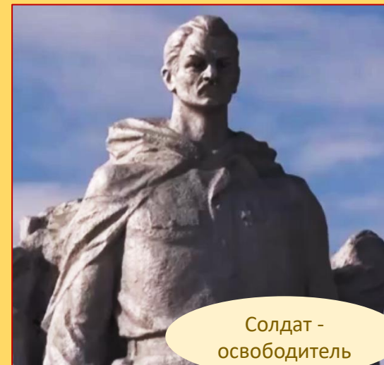
Солдат - освободитель