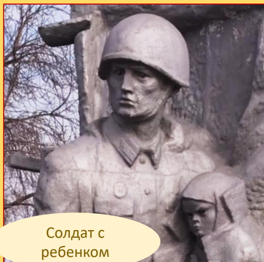
Солдат с ребенком