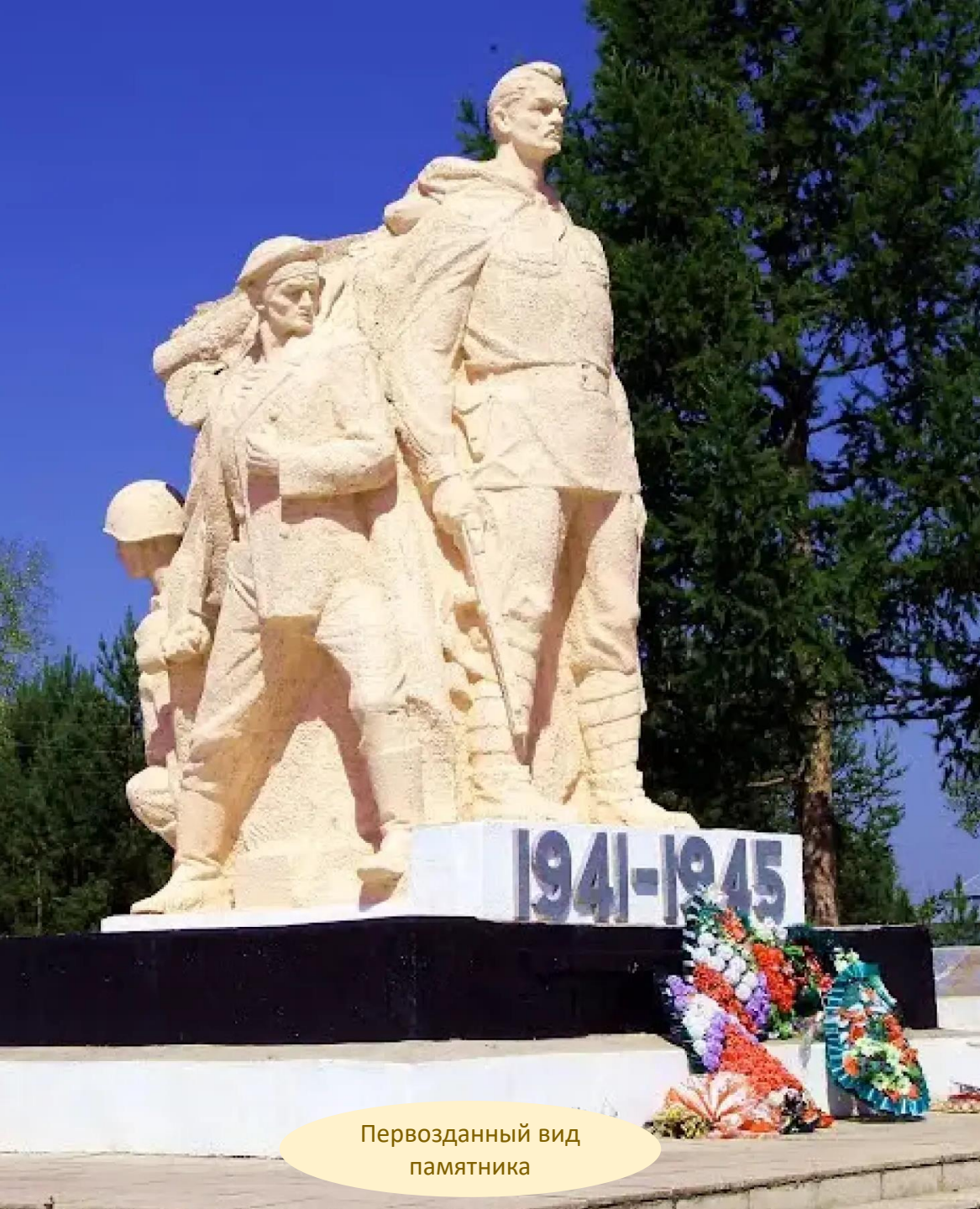
Первозданный вид памятника

Открытие памятника состоялось 9 мая 1989 года.